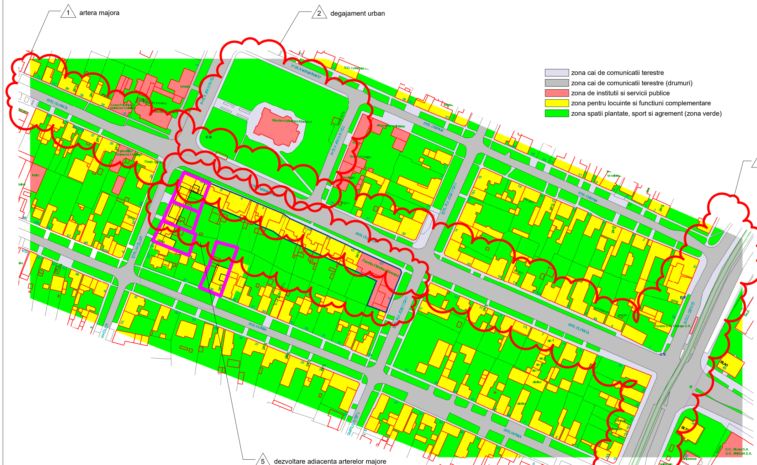
plan de situatie propus cvartal